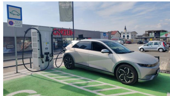
Qelo punionica – Lučko