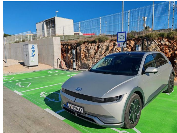
Lokacija: Qelo Sun Park Vodice