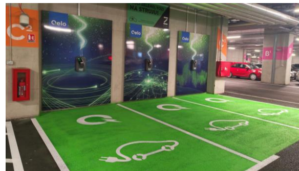
Qelo punionica – Z centar Zagreb Špansko